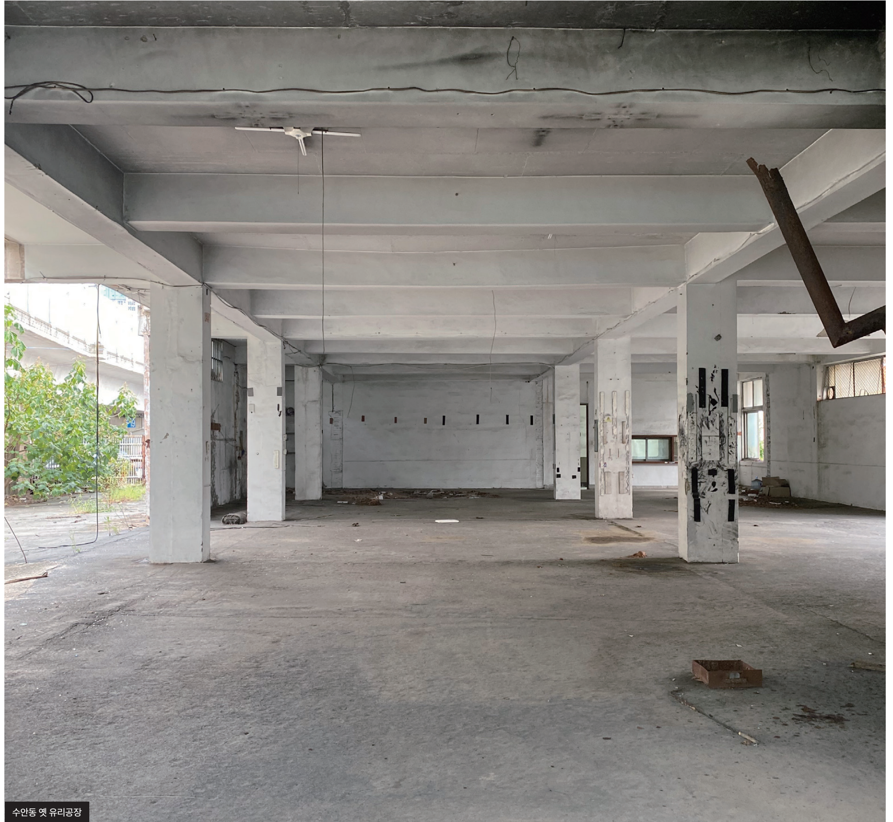
수안동 옛 유리공장

문의가 가장 많은 폐건물들의 집합소다. 비어있는 공간이기에 원하는대로, 필요한대로 어떠한 세팅도 자유자재로 구현할 수 있는 만능 로케이션이라 할 수 있다.